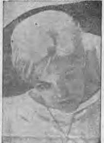
Kim Novak trabajará en una película rusa-norteamericana