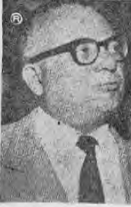
ROMULO BETANCOURT ...está convocando a la OEA

WASHINGTON, 18. AP— Venezuela suplicó hoy la convocatoria a una reunión de Ministros de Relaciones Exteriores Americanos para protestar por la toma del poder por los militares en el Perú, pero las fuentes diplomáticas dudaron aquí que tal iniciativa lograría reunir las dos terceras partes de los votos que se requieren para convocar tal conferencia. Los Estados Unidos fueron sondeados por medio de una proposición venezolana, que se hizo en forma de solicitud de apoyo para tal reunión. Se tiene entendido que el gobierno norteamericano no asumió posición alguna respecto al plan.