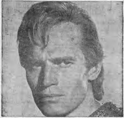
Charlton Heston filmó "The Pigeon that Took Rome"

Según informaron los diarios de El Cairo, algunos efectivos militares de la RAU tomarán parte en las escenas para la película. "Miss Taylor tendría que rodar una escena final aquí junto a la esfinge y las pirámides", declaró Burton. "Si no puede obtener una visación para entrar a Egipto la escena tendrá que ser filmada en alguna otra parte".