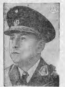
ODRÍA ...perdió la presidencia en la misma forma que una vez la ganó

gobierno, arrestaron al presidente Manuel Prado y dieron que una Junta Militar prestara juramento en ceremonia pública en el Palacio Nacional.