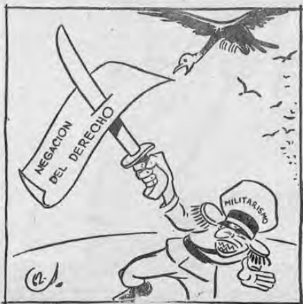
la mala noticia...