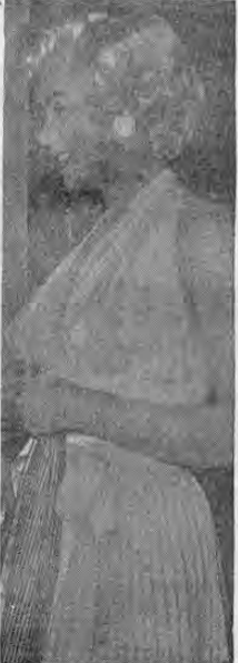
Venden fotos de Marilyn en 50,000 dólares

Dahl tuvo que dejar de actuar en cine para probar que es una actriz dueña de muy estimables cualidades. Graciosa, inteligente y muy intencionada. En el cine era sólo una imponente presencia por su pelloroja belleza. Par ticipo en más de 33 films y la que no recuerda usted ni uno solo de ellos? En cambio, la otra noche que la vi en el cabaret Latin Quarter de Nueva York y me causó una impresión verdaderamente memorable. ¿La descubrirá de nuevo el cine?..