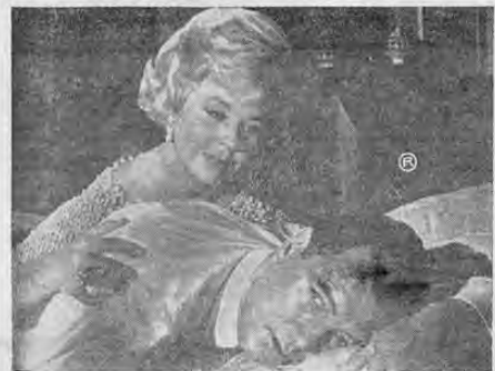
Rock Hudson y Doris Day en una escena de "Vuelve Amor Mío"