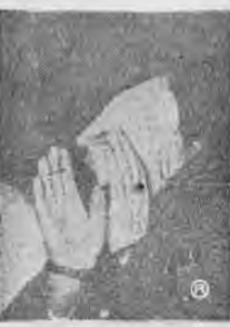
ROBERT SOBLEN ...está pidiendo asilo en Inglaterra

● LONDRES, 18 (AP)—Tres jueces de un alto Tribunal británico rechazaron hoy el pedido del espía soviético Robert Soblen de que se le conceda la libertad en suelo británico, pero le permitieron apelar la decisión.