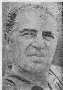
BELAUNDE TERRY ...apoya el golpe contra la Constitución

El General Ricardo Pérez Godoy, Presidente de la Junta Militar y Ministro de Finanzas, considerado como el cerebro del golpe militar ocurrido esta mañana, es alto, con esca-